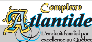
Complexe Atlantide 20 juillet