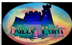
Royaume de Nul Part 6 juillet